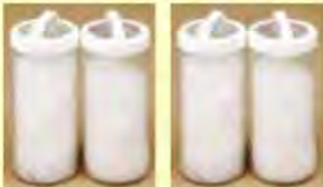
40グラムの足し羽毛です。

あなたの羽毛ふとんのえり元に 40グラム ※ の羽毛を足します。 えり元がふっくらと!