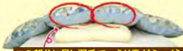
この部分に足し羽毛で、えり元がふっくら